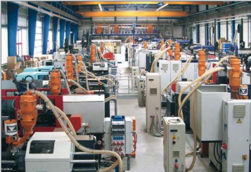
Zentralförderanlage mit zentraler Trocknung (im Hinter- grund drei CKT-Trockner mit Trocknungsbehältern) sowie Dosier- und Einfärbgeräte