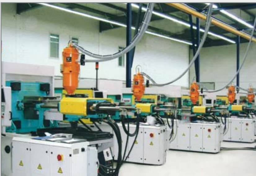
Zentralförderanlage mit Förderabscheidern