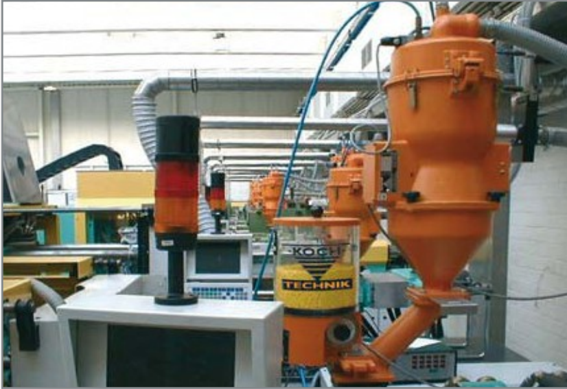
Zentralförderanlage mit KEM Direkteinfärbgeräten