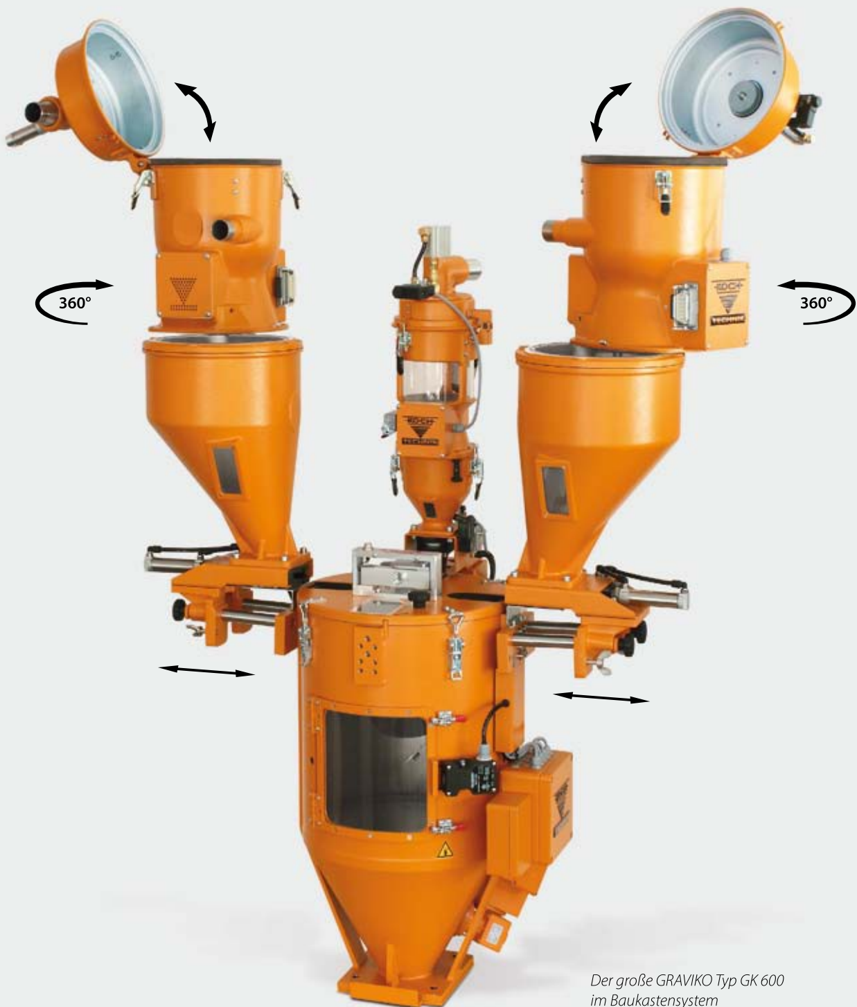
Der große GRAVIKO Typ GK 600 im Baukastensystem