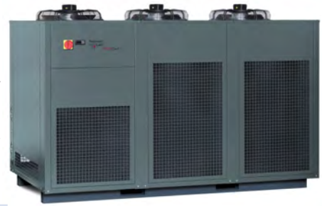
PCGE 1090 (mit Option Sonderfarbe RAL 7043, verkehrsgrau B) (PCGE 3150 mit drei bzw. PCGE 3650 mit vier Ventilatoren)