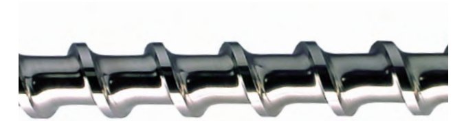
Plastifizierschnecken für alle Anwendungen